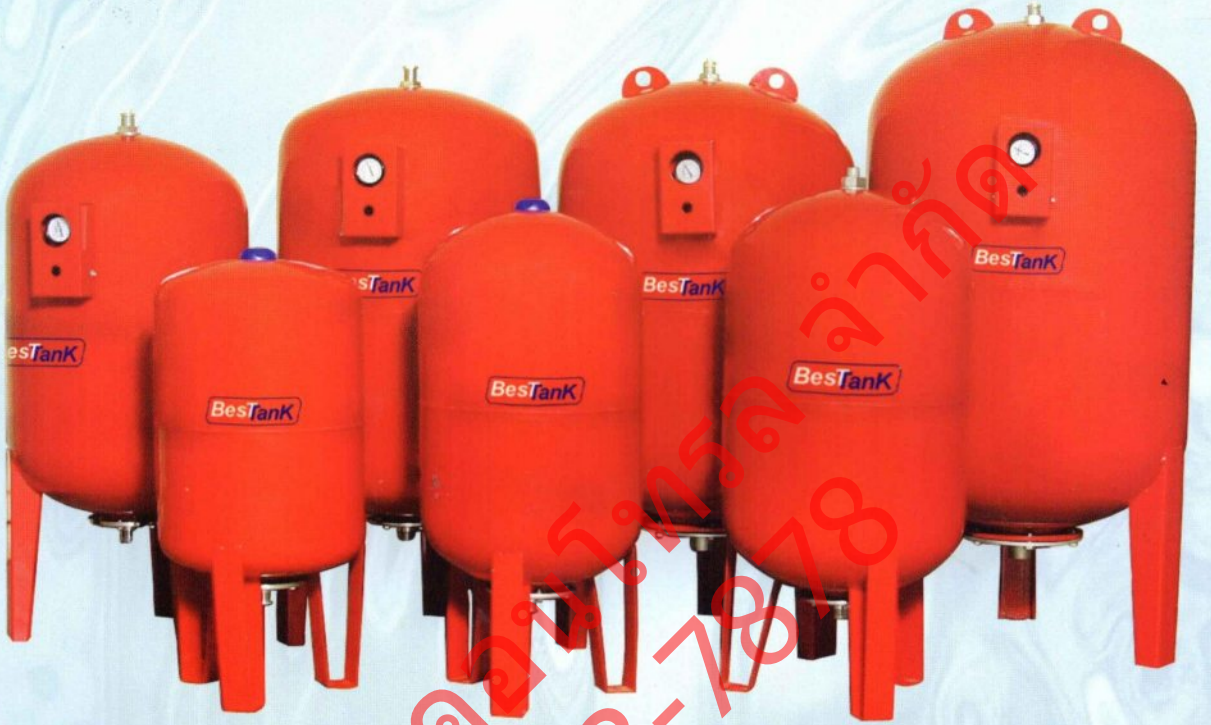
DIKEY AYAKLI GENLEME TANKLARI TEKNİK ÖZELLİKLERİ TECHNICAL SPECIFICATIONS OF VERTICAL EXPANSION VESSELS (WITH LEGS)