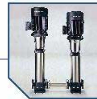
Pump pressure up to 45 bar