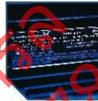
CE MEP Eff1 motors