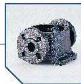
DIN, JIS and ANSI flange