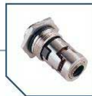
Many seal face materials available