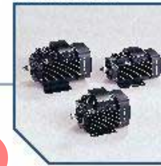
Alternative viscosity or density