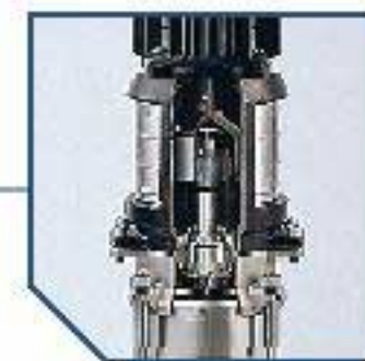
Magnetic coupled pump