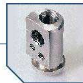
Customer specified solutions