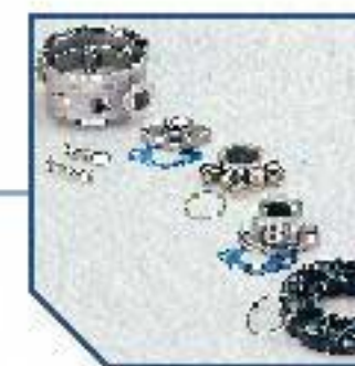
External thread (+GF+)