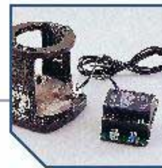
For dry running/ motor protection